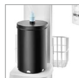
Bote de filtro de gas