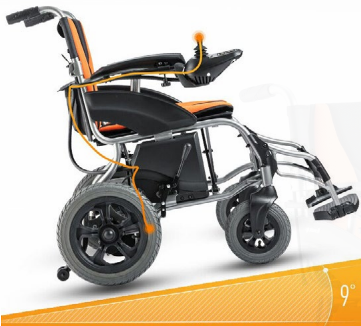
Diseño anti-deslizamientos en pendientes.