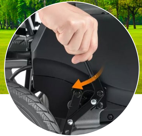
Freno automático en modo eléctrico y control de freno manual al estar apagado.