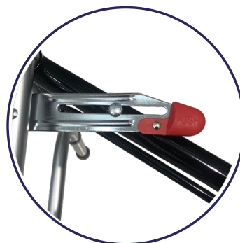
Mecanismo de plegado con doble botón