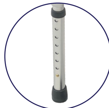
4 Patas con 8 Niveles para ajustar la altura