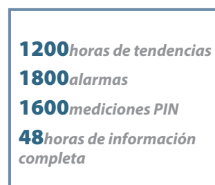
Enorme capacidad de datos