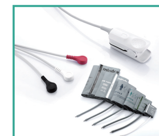
Accesorios de alta calidad