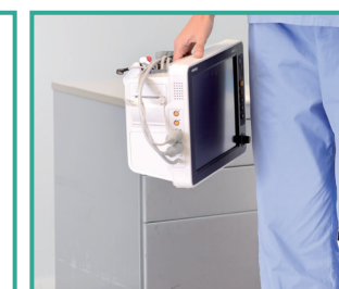
Protección contra caídas