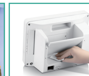
Compatible con múltiples agentes de limpieza