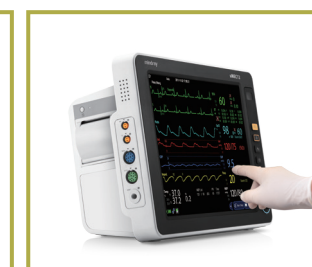
Interfaces fáciles de usar