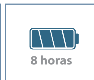
Batería de larga duración