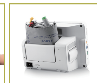
Gabinete exclusivo para accesorios