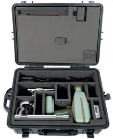
Estuche incluido "Flat Panel se vende por separado"

Investigación de vida silvestre y conservación