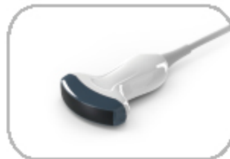
2.5MHz - 5.0MHz Convexo C3-A