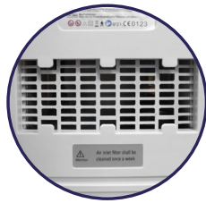
Primer Filtro de Espuma