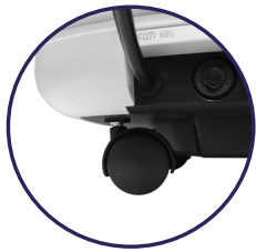
Rueda con Freno