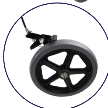
4 Llantas de PVC