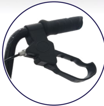
Agarraderas con sistema de frenos de bloqueo automático