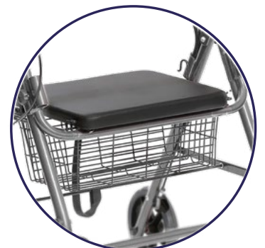
Asiento acojinado y canasta de compras