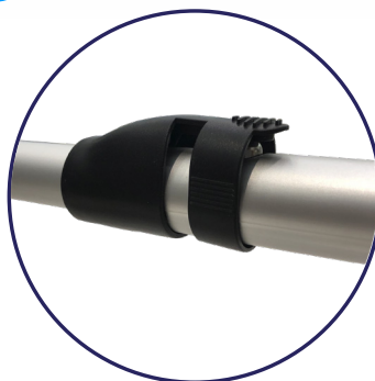
Mecanismo de plegado con botón al centro