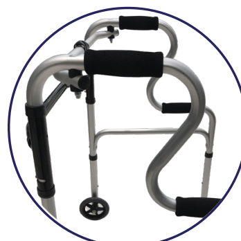
Marco con diseño curvo