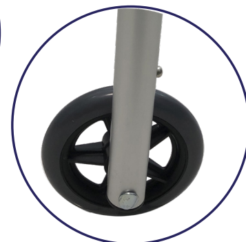
2 Patas delanteras con ruedas de 5" de PVC