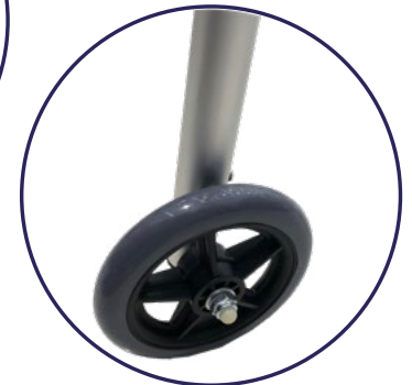
2 Patas delanteras con ruedas de 5" de PVC