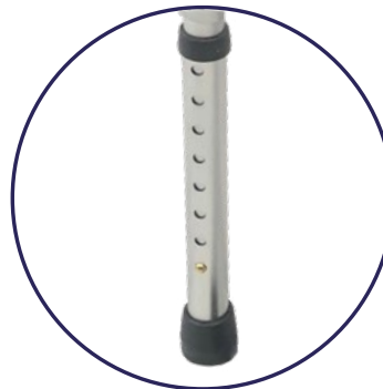
2 Patas traseras con 8 Niveles para ajustar la altura