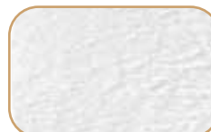
COSY Microfibras de felpa